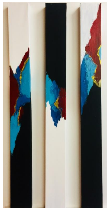
9. Juni: Acryl 3Stck. 10x100XL