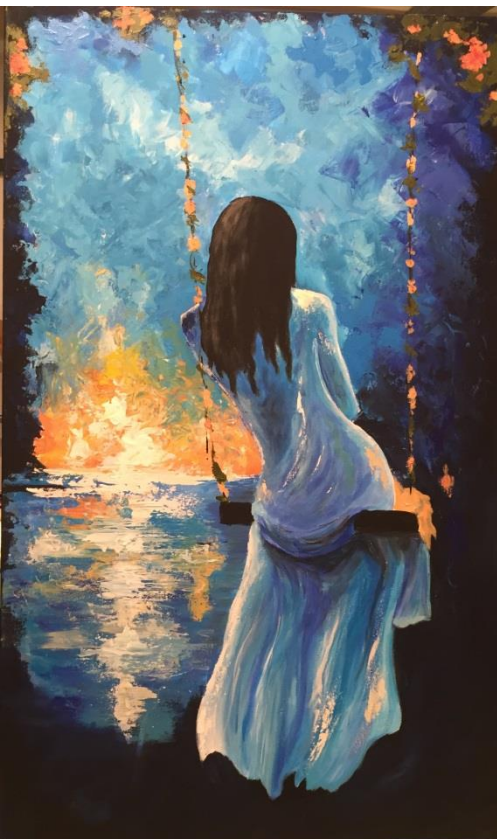
24. März: Acryl Spachteltechnik 60x90cm