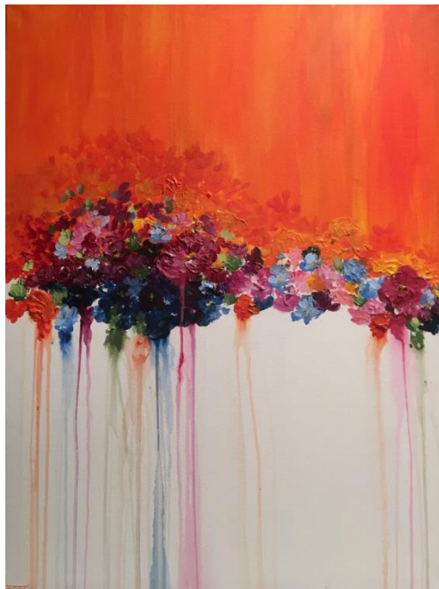
26. Mai: Acryl 60x80cm