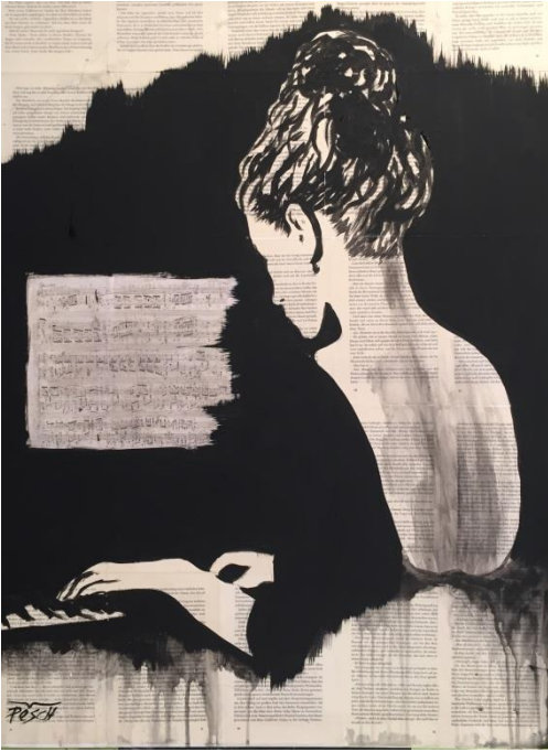
10. März: Acryl 60x80cm