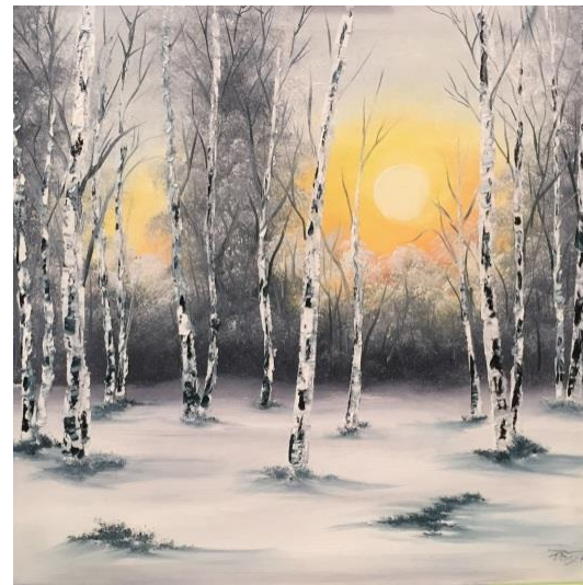
14. April: Bob Ross 60x60cm