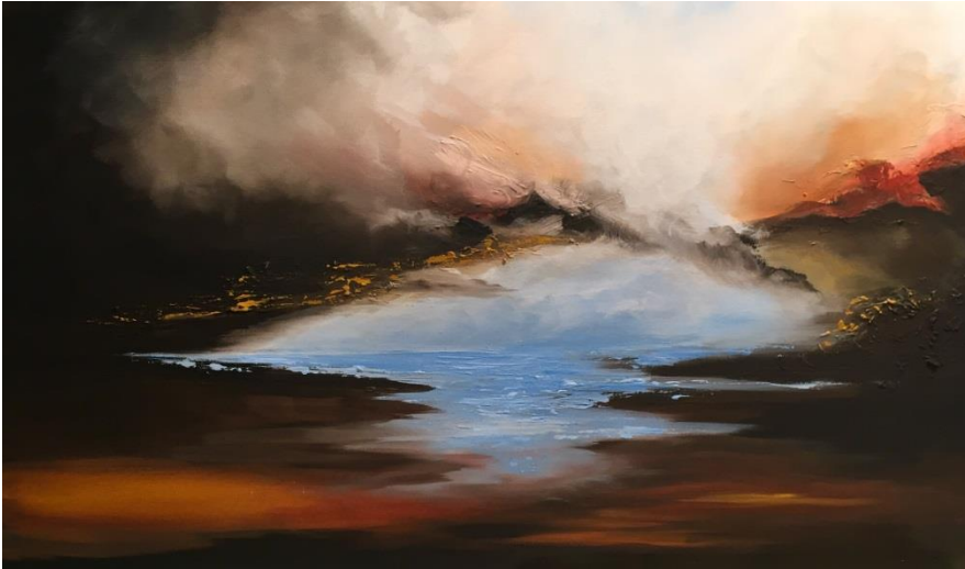
1. Mai: Acryl 60x90cm